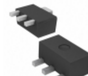
AZ7023RTR-E1 Diodes Incorporated IC RESET GENERATOR