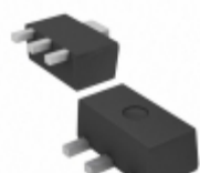
AZ7023RTR-G1 Diodes Incorporated IC RESET GENERATOR