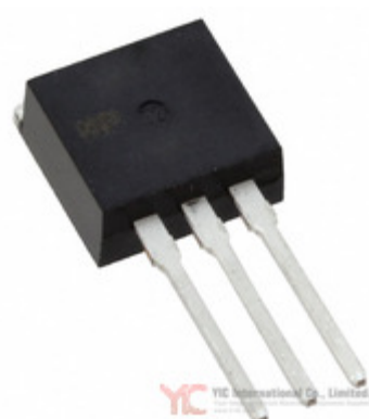
Image may be representation. See specs for product details.