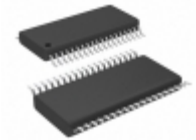
ADM2209EARUZ Analog Devices Inc. IC TXRX6/10 RS-232 12V 38TSSOP