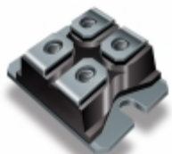
VS-UFL200CB60P Electro-Films (EFI) / Vishay DIODE GEN PURP 600V 142A SOT227