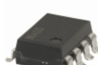
AQW282EHAZ Panasonic RELAY OPTO AC/DC 60V 400MA 8-SMD