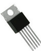
MCP1826-0802E/AT Microchip Technology IC REG LDO 0.8V 1A TO220-5