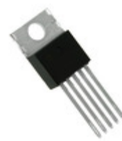
MCP1826-1802E/AT Microchip Technology IC REG LDO 1.8V 1A TO220-5