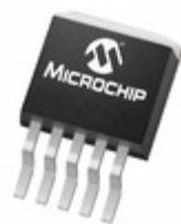
MCP1826-2502E/ET Microchip Technology IC REG LDO 2.5V 1A DDPK