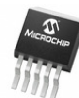
MCP1826-1202E/ET Microchip Technology IC REG LDO 1.2V 1A DDPK