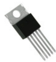
MCP1826-2502E/AT Microchip Technology IC REG LDO 2.5V 1A TO220-5