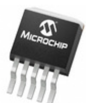
MCP1826-1802E/ET Microchip Technology IC REG LDO 1.8V 1A DDPK