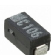
F970J336MAA AVX Corporation CAP TANT 33UF 6.3V 20% 1206