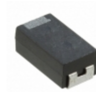
F970J336MCCHT3 AVX Corporation CAP TANT 33UF 20% 6.3V 2312