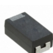
F970J476KCC AVX Corporation CAP TANT 47UF 6.3V 10% 2312