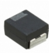
F970J476KBA AVX Corporation CAP TANT 47UF 6.3V 10% 1411