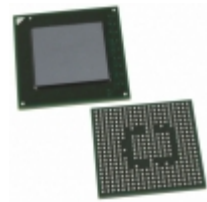
EP2AGX65CU17C6NES Altera IC FPGA 156 I/O 358UBGA