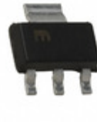
MIC5209-3.0YS Microchip Technology IC REG LDO 3V 0.5A SOT223