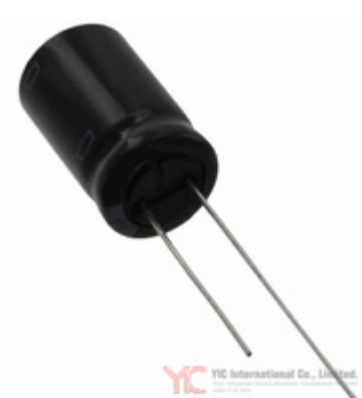
Image may be representation. See specs for product details.