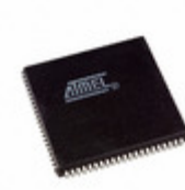
ATF1508ASL-25JU84 Microchip Technology IC CPLD 128MC 25NS 84PLCC