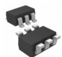
MAX5462EXT+T Maxim Integrated IC POT DGTL 32-TAP 2WIRE SC70-6