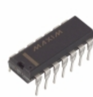
MAX545BEPD Maxim Integrated IC DAC SERIAL +5V 14BIT 14-DIP