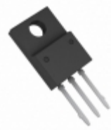
BA78M18CP-E2 Rohm Semiconductor IC REG LDO 18V 0.5A TO220CP-3