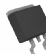
BA78M20FP-E2 Rohm Semiconductor IC REG LDO 20V 0.5A TO252-3