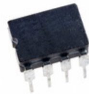
HI-3001CRH Holt Integrated Circuits Inc. IC TRANSCEIVER CAN 8-CERDIP