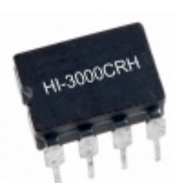
HI-3000CRH Holt Integrated Circuits Inc. IC CAN TRANSCEIVER 8-CERDIP