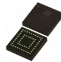
LC4064ZC-5MN56I Lattice Semiconductor Corporation IC CPLD 64MC 5NS 56CSBGA