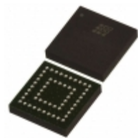
LC4064ZC-5M56C Lattice Semiconductor Corporation IC CPLD 64MC 5NS 56CSBGA