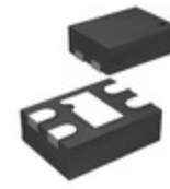
MIC94310-PYMT-TR Microchip Technology IC REG LDO 3V 0.2A 4TMLF