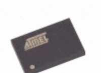
AT45DB041B-CC-2.5 Microchip Technology IC FLASH 4MBIT 15MHZ 14CBGA