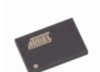
AT45DB041B-CI Microchip Technology IC FLASH 4MBIT 20MHZ 14CBGA