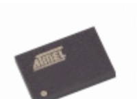
AT45DB041B-CI-2.5 Microchip Technology IC FLASH 4MBIT 15MHZ 14CBGA