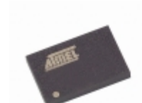
AT45DB041B-CC Microchip Technology IC FLASH 4MBIT 20MHZ 14CBGA