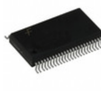
74LVT162240MEA Fairchild/ON Semiconductor IC INVERTER DUAL 8-INPUT 48SSOP