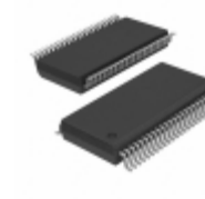
74LVT162240ADL,112 Nexperia USA Inc. IC INVERTER QUAD 4-INPUT 48SSOP