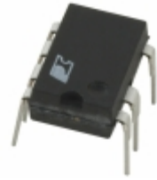
PKS603PN Power Integrations IC OFFLINE SWIT OTP OCP HV 8DIP