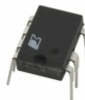
PKS604PN Power Integrations IC OFFLINE SWIT OTP OCP HV 8DIP