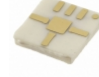
HMC329LM3 ADI (Analog Devices, Inc.) IC MMIC IQ MIXER 26-40GHZ 6SMD