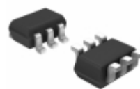
HMC333ETR ADI (Analog Devices, Inc.) IC MIXER GAAS 3.0-3.8GHZ SOT-26