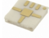
HMC329LM3TR ADI (Analog Devices, Inc.) IC MMIC IQ MIXER 26-40GHZ 6SMD