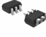
HMC333E ADI (Analog Devices, Inc.) IC MIXER GAAS 3.0-3.8GHZ SOT-26