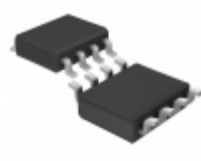
LTC1174HVIS8#PBF Linear Technology IC REG BUCK BOOST INV ADJ 8SOIC