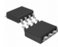
LTC1174HVIS8#TRPBF Linear Technology IC REG BUCK BOOST INV ADJ 8SOIC