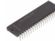
DS89C440-MNG Maxim Integrated IC MCU 8BIT 32KB FLASH 40DIP