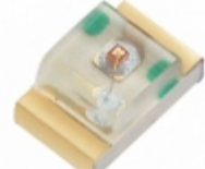
XZTHI54W SunLED EMITTER IR 880NM 50MA 0805