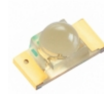
XZTHI55W-3 SunLED EMITTER IR 880NM 50MA 1206