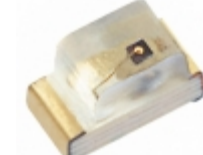
XZTNI53W SunLED EMITTER IR 940NM 50MA 0603