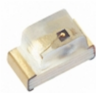
XZTHI53W SunLED EMITTER IR 880NM 50MA 0603