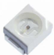
XZTHI45S SunLED EMITTER IR 880NM 50MA PLCC