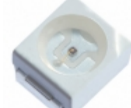
XZTNI45S SunLED EMITTER IR 940NM 50MA PLCC