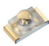
XZTNI53W-8 SunLED EMITTER IR 940NM 50MA SMD