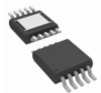
LT3042MPMSE#TRPBF Linear Technology IC REG LDO ADJ 0.2A 10MSOP