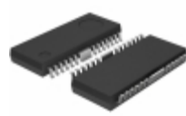
BD6212FP-E2 Rohm Semiconductor IC MOTOR DRIVER PAR 25HSOP