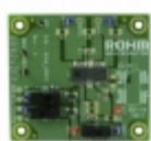
BD6212FP-EVAL-N LAPIS Semiconductor BOARD EVAL FOR BD6212FP