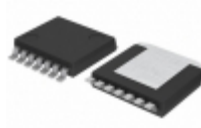
BD6221HFP-TR Rohm Semiconductor IC MOTOR DRIVER PAR HRP7