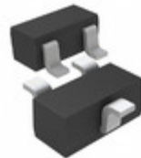
DTB713ZETL Rohm Semiconductor TRANS PREBIAS PNP 150MW EMT3