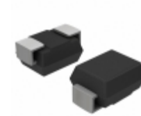
MMT10B310T3G ON Semiconductor THYRISTOR 270V 100A SMB