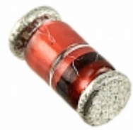
ZMY3V9-GS18 Electro-Films (EFI) / Vishay DIODE ZENER 3.9V 1W DO213AB