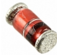
ZMY3V9-GS08 Electro-Films (EFI) / Vishay DIODE ZENER 3.9V 1W DO213AB