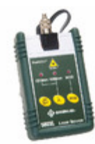
580XL-FC Greenlee Communications LED SOURCE FC CONNECTORS