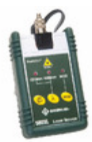
580XL-SC Greenlee Communications LED SOURCE SC CONNECTORS