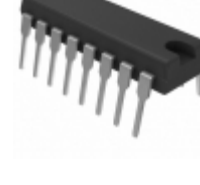
N74F161AN,602 NXP USA Inc. IC COUNTER 4BIT BINARY 16DIP