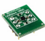
MIC94325YMT-EV Micrel / Microchip Technology EVAL BRD ADJ 500MA LDO MIC94325