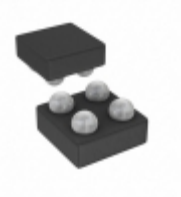
MIC94310-SYCS-TR Microchip Technology IC REG LDO 3.3V 0.2A 4WLCSP