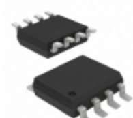
FOD2742A Fairchild/ON Semiconductor OPTOISO 2.5KV TRANSISTOR 8SOIC