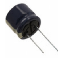
EEU-FC1C182SB Panasonic Electronic Components CAP ALUM 1800UF 20% 16V RADIAL