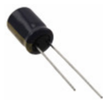
EEU-FC1C221B Panasonic Electronic Components CAP ALUM 220UF 20% 16V THRU HOLE