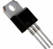
TYN208RG STMicroelectronics SCR 200V 8A TO220AB