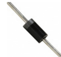
BZX85C4V7 AMI Semiconductor / ON Semiconductor DIODE ZENER 4.7V 1W DO41