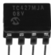
TC427MJA Microchip Technology IC MOSFET DVR 1.5A DUAL HS 8CDIP