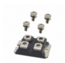
IXKN40N60C IXYS MOSFET N-CH 600V 40A SOT-227B