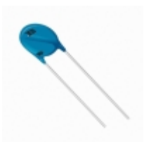
MOV-10D391K Bourns Inc. VARISTOR 390V 2.5KA DISC 10MM