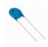
MOV-10D471KTR Bourns Inc. VARISTOR 470V 2.5KA DISC 10MM