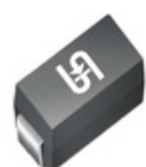
1SMA5954HR3G TSC (Taiwan Semiconductor) DIODE ZENER 160V 1.5W DO214AC