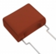
ECW-FA2J125JB Panasonic Electronic Components CAP FILM 1.2UF 5% 630VDC RADIAL