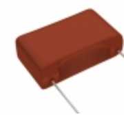
ECW-FA2J154J Panasonic Electronic Components CAP FILM 0.15UF 5% 630VDC RADIAL