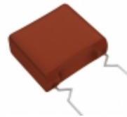
ECW-FA2J125JQ Panasonic Electronic Components CAP FILM 1.2UF 5% 630VDC RADIAL