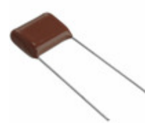
ECQ-E6154RKf Panasonic Electronic Components CAP FILM 0.15UF 10% 630VDC RAD