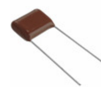
ECQ-E6154KF3 Panasonic Electronic Components CAP FILM 0.15UF 10% 630VDC RAD