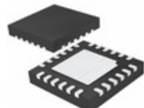
LT3688IUF#TRPBF Linear Technology IC REG BUCK ADJ 0.8A DL 24QFN