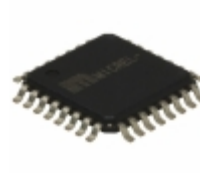
SY89529LTH Microchip Technology IC SYNTHESIZER CLK 200MHZ 32TQFP