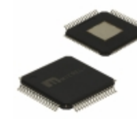
SY89468UHY Microchip Technology IC CLK BUFFER 2:20 1.5GHZ 64TQFP