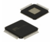
SY89467UHY-TR Microchip Technology IC CLK BUFFER 2:20 2GHZ 64TQFP