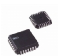
AD7225LP Analog Devices Inc. IC DAC 8BIT QUAD W/AMP 28-PLCC