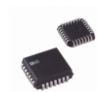
AD7225LPZ Analog Devices Inc. IC DAC 8BIT QUAD W/AMP 28-PLCC