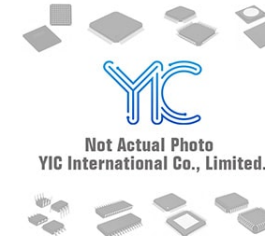
SY100ELT20VZITR MICREL SY100ELT20VZITR MICREL