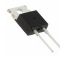
DPG15I200PA IXYS DIODE GEN PURP 200V 15A TO220AC