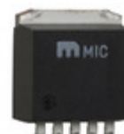
MIC5209-2.5YU-TR Microchip Technology IC REG LDO 2.5V 0.5A TO263-5