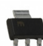
MIC5209-3.0YS Microchip Technology IC REG LDO 3V 0.5A SOT223