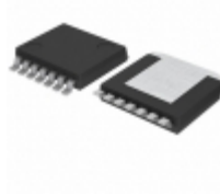
BD9778HFP-TR Rohm Semiconductor IC REG BUCK ADJ 2A HRP7