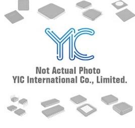
BD9776HFP-TR ROHM BD9776HFP-TR ROHM