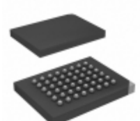
SST38VF6404-90-5I-B3KE Microchip Technology IC FLASH 64MBIT 90NS 48TFBGA