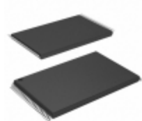
SST38VF6404-90-5I-EKE Microchip Technology IC FLASH 64MBIT 90NS 48TSOP