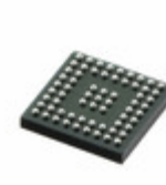
CS42L73-CRZ Cirrus Logic Inc. IC CODEC AUD TELEPHONY 64WLCSP